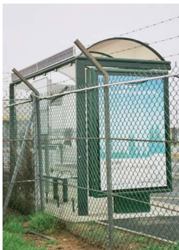
Module solaire placé à la verticale au dos de l'abri bus pour éclairage.