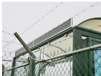
Module solaire capable de recharger une batterie hiver comme été pour abri bus solaire.