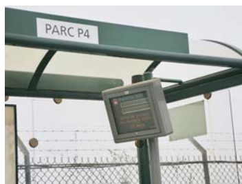
Système d'éclairage et d'informations usagées autonomes par énergie solaire.