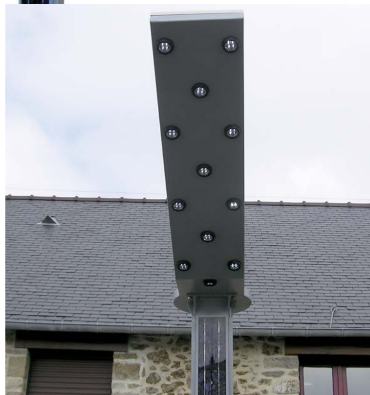
Projecteur directionnel à LED en haut du poteau