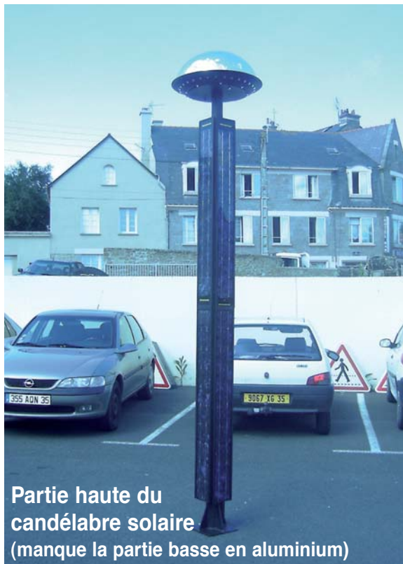
Partie haute du candélabre solaire (manque la partie basse en aluminium)