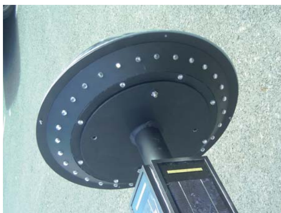
Projecteur omnidirectionnel à LED en haut du poteau