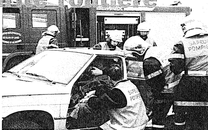
Exercice de désincarcération

Plaine avec la participation d'un groupe théâtral le 14 avril - Stand sécurité routière le 26 avril au lycée Renaudeau de Cholet organisé par une classe de 3 ème . La demande tend à s'essouffler aussi, l'information sera relancée en 2002 au niveau national dans tous les établissements accueillant des jeunes de 14 à 28 ans. Elle sera bien entendu relayée au niveau local. Nous avons